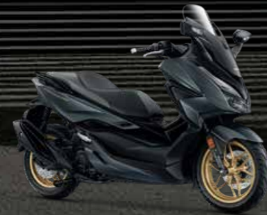
G-B (Grey-Black) เทา-ดำ