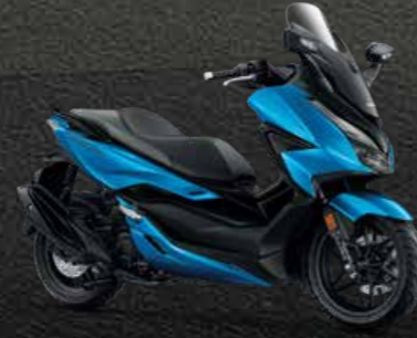
BUB (Blue-Black) น้ำเงิน-ดำ