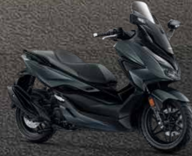
G-B (Grey-Black) เทา-ดำ