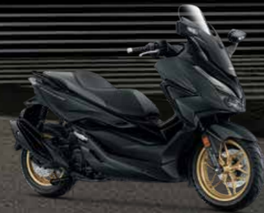
BLK (Black) ดำ