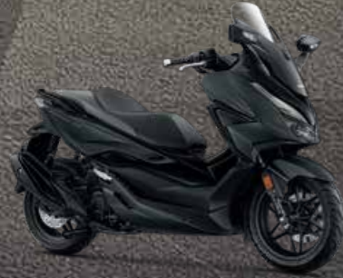
BLK (Black) ดำ