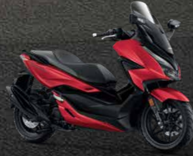
R-B (Red-Black) แดง-ดำ